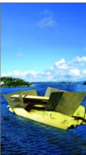
VISION: Stavangers svar på Operahuset i Sydney? (Illustrasjon: Harald M. Gjovaa, Alliance Arkitekter)

– Da lå skjæret langt fra folk. Men nå ligger det jo nærmest midt i et boligfelt med hus på begge kanter ned mot sjøen, sier Hop. Etter at han overtok skjæret, har han fått utarbeidet flere spenstige arkitektskisser med ønske om å