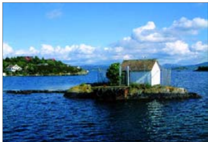
FØR: Lagerhytta på skjæret var inngjerdet og ble brukt til å lagre dynamitt. (Foto: Privat)

Ola Fintland | tekst Jon Ingemundsen | foto Kjell Arvid Berge | grafikk